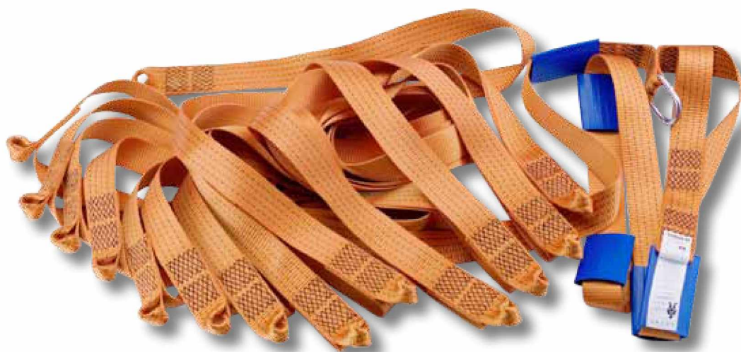
GC25 Cinta anillada de 25 metros.